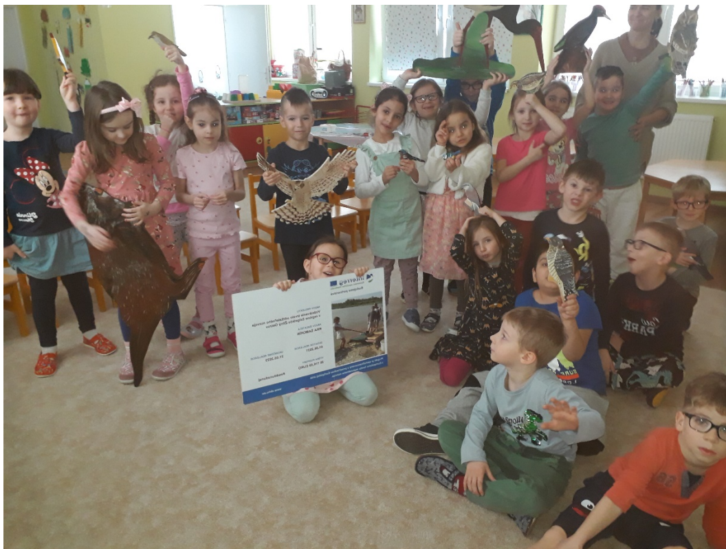
2023.03.13 Šamorín Gazdovská u. Sk skupina