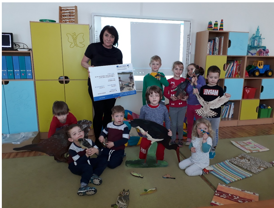
2023.03.17 Šamorín Poľovnícka u. Sk skupina