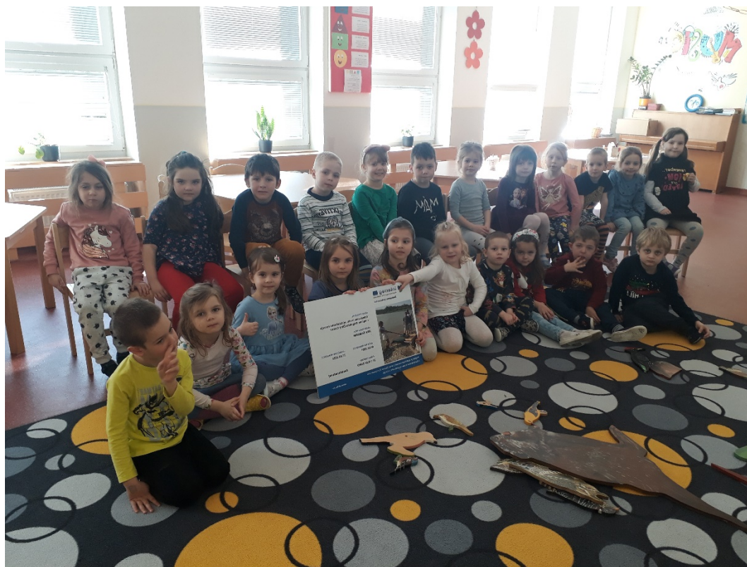
2023.03.02 Šamorín Školská ulica s VJM