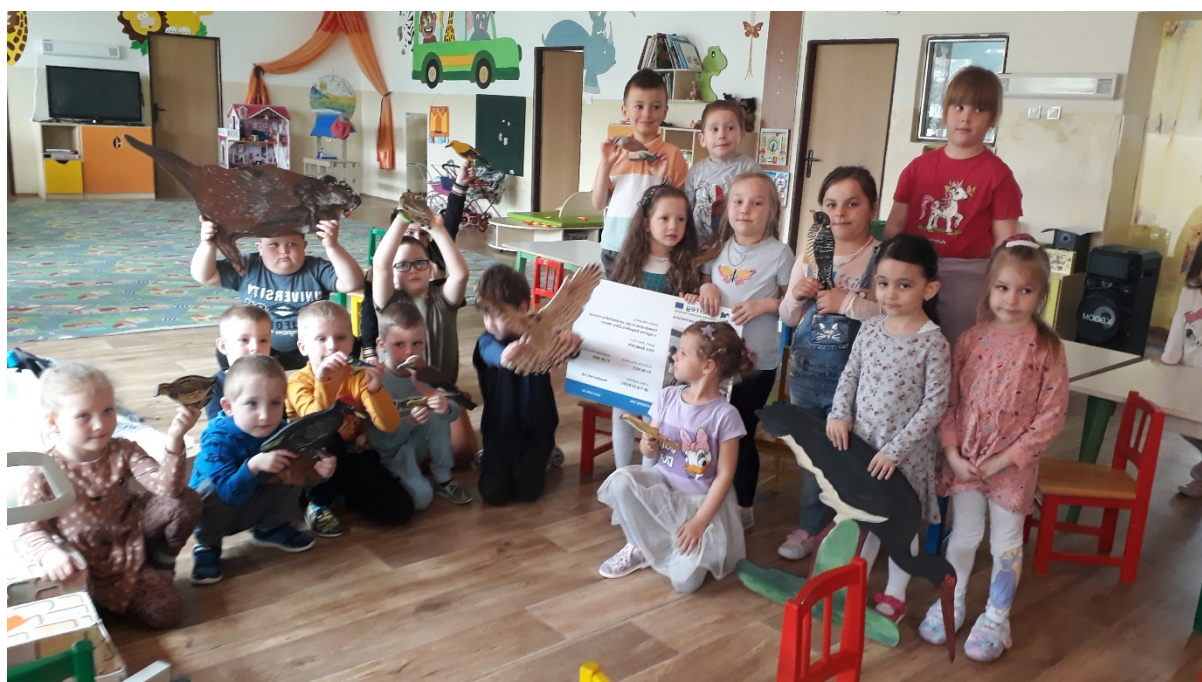
2023.04.18 Lehnice Sk skupina