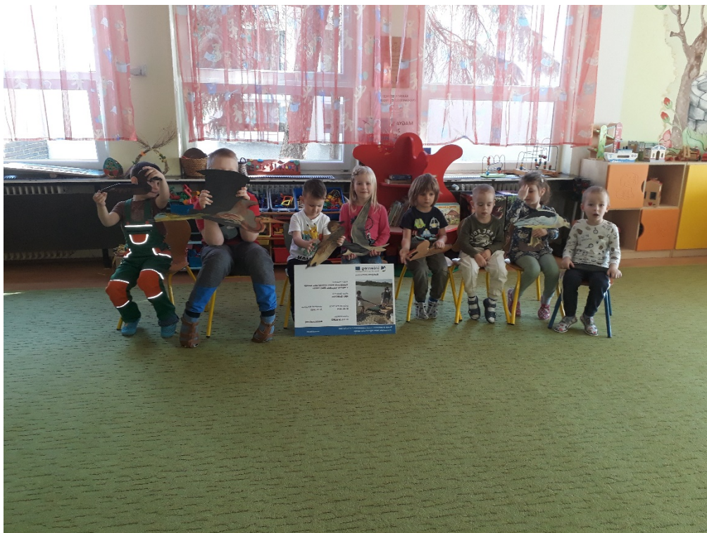
2023.03.21 Šamorín ul. Márie Sk skupina